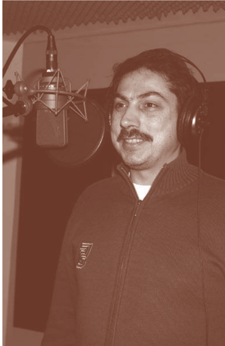
1 Von Herbst 2006 bis Herbst 2009 förderte das Bundesamt für Migration und Flüchtlinge 16 Modellprojekte zur Stärkung des bürgerschaftlichen Engagements von Migrantinnen und Migranten, darunter auch in drei Freiwilligenagenturen. Ausgewertete Projekterfahrungen lagen somit erst gegen Ende der Projektlaufzeit von gemeinsam engagiert vor. Bundesamt für Migration und Flüchtlinge/ Stiftung Bürger für Bürger (2009): Engagiert für Integration – Erkenntnisse und Handlungsempfehlungen aus 16 Modellprojekten zum interkulturellen bürgerschaftlichen Engagement.

Die Freiwilligenagentur ist mit der Entwicklung der „Ingolstädter Brückenbauer“ sehr zufrieden und sieht sie als eine ihrer zentralen und besonders dynamischen Projekte an, das sie auf jeden Fall auch nach dem Wegfall der Begleitung und finanziellen Unterstützung durch gemeinsam engagiert fortsetzen möchte. Obwohl die Freiwilligenagentur keinerlei Grundförderung erhält, ist die Finanzierung der Projektleitung inzwischen bis Ende 2010 gesichert. Die Akquise weiterer, für die Projektfortführung benötigter Finanzmittel wird gemeinsam von der Freiwilligenagentur und der Projektleitung organisiert, da die Freiwilligen ihre Zeitressourcen auf die geplanten Aktivitäten konzentrieren möchten.